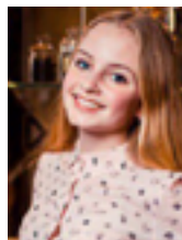
Автор статьи Найденова Юлия