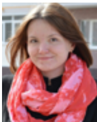
Автор статьи Александра Воробьева