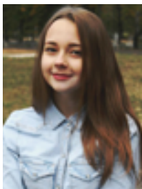
Автор статьи Мария Захарова